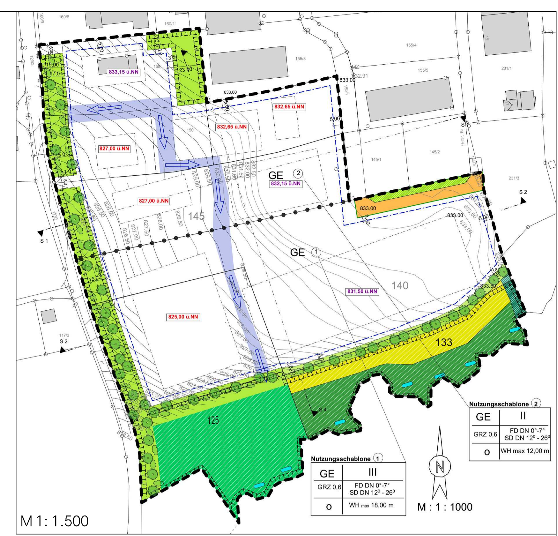
6. Änderung und Erweiterung Bebauungsplan "Gewerbepark Westerhof" mit integriertem Grünordnungsplan (Fassung vom 07.02.2022)